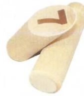
Paaltje 7 is niet omgevallen