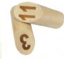
Paaltje 3 is wel omgevallen, paaltje 11 niet

Belangrijk: een paaltje geldt als omgevallen als deze volledig op de grond ligt. Als een paaltje gedeeltelijk op een ander paaltje of op de mólkky ligt, of er tegenaan leunt, scoort de speler er geen punten voor. Mocht een paaltje door het weghalen van de mólkky omvallen, dan wordt deze wel rechtop gezet, maar krijgt de speler er alsnog geen punten voor.